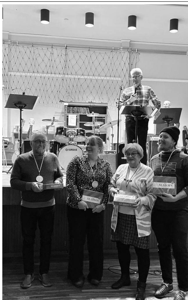
Kvällens vinnande lag – Grattis!!!

Desto större bragd att vinna hela tävlingen – Grattis till vinnarna